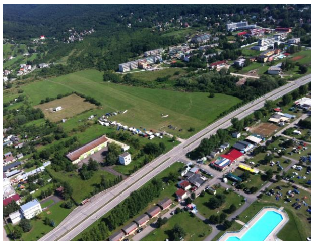
Ubytování hotel Felicia u letiště