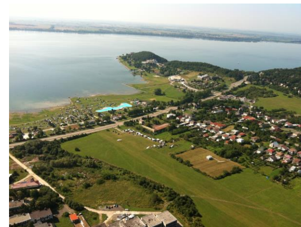
Zemplínská Šírava letiště Kaluža